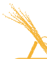
日本唯一の茅葺きの駅舎 湯野上温泉駅