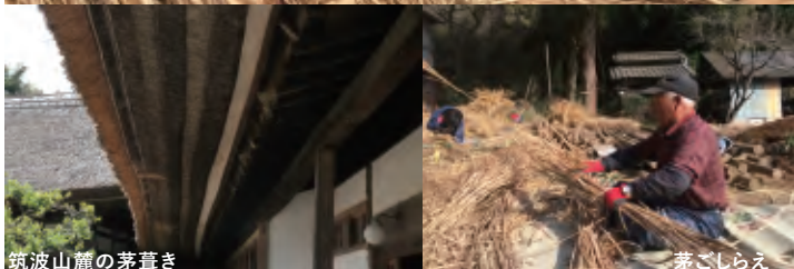
筑波山麓の茅葺き