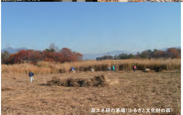
高エネ研の茅場(ふるさと文化財の森)

申込書 FAXまたはメールにてお申し込みください。締切9/25(金) FAX: 029-867-5829 Mail: info@kayabun.or.jp