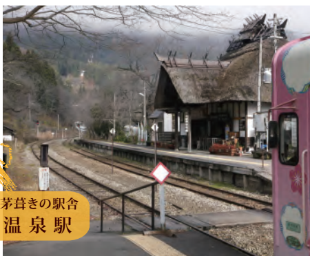
日本唯一の茅葺きの駅舎 湯野上温泉駅