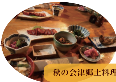
秋の会津郷土料理

8:30 集合 8:30~9:00 あいさつ、注意事項など 9:00~12:00 茅刈り体験研修 12:00~13:00 昼食 秋の会津郷土弁当 13:00~14:30 茅刈り体験研修 15:00 解散、集落内自由見学